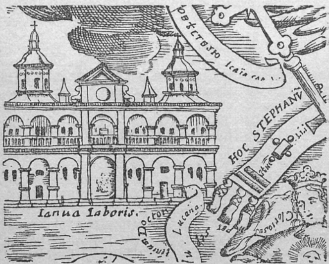
Фрагмент Мігуриної гравюри.

а на саму Академію витратив більше як 200.000 золотих*).