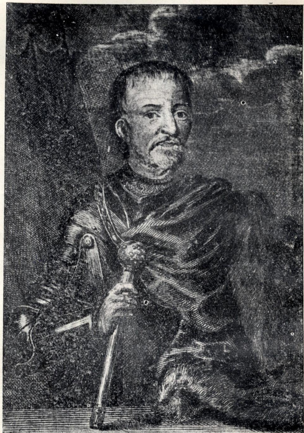
Johannes Mazepa, Cosaccorum Zaporoviensium Supremus Billi-Dux.