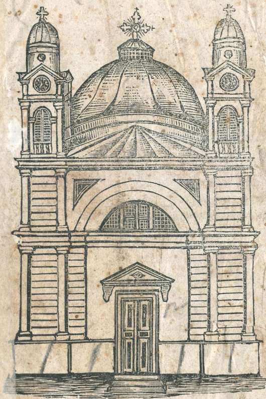
Церковь Михайловская въ Коломыи.