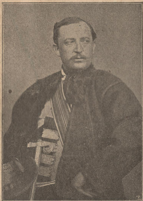
ОСИП ЮРИЙ ФЕДЬКОВИЧ.