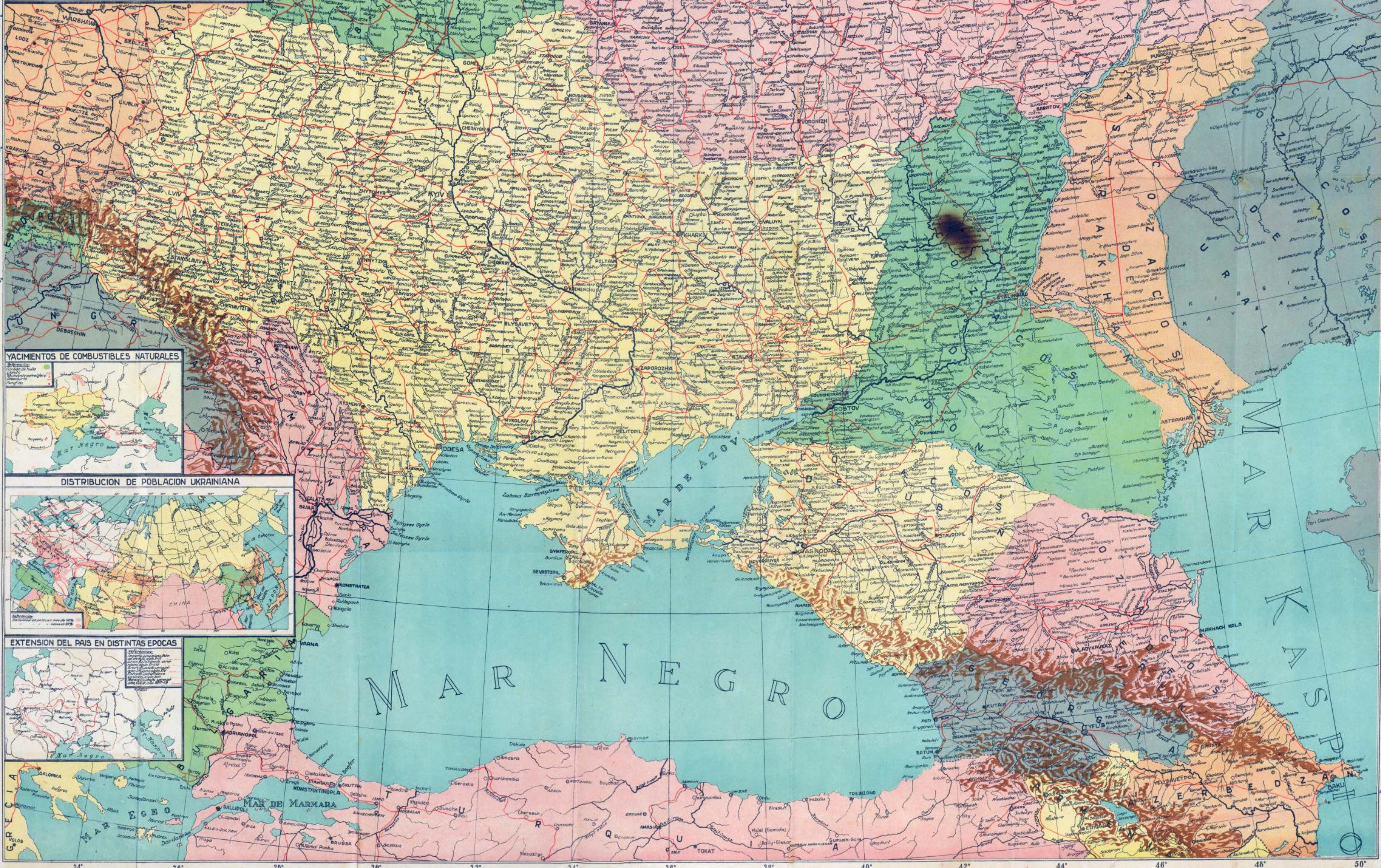
YACIMIENTOS DE COMBUSTIBLES NATURALES

AGUAS MEDICINALES Y LUGARES DE VERANEO YACIMIENTOS DE MINERALES METALOIDES YACIMIENTOS DE MINERALES METALURGICOS