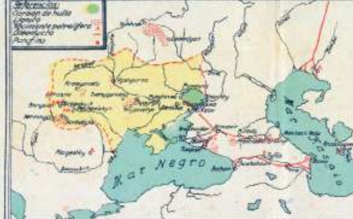
DISTRIBUCION DE POBLACION UKRAINIANA