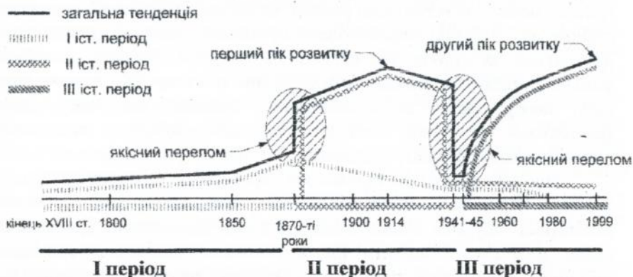
Рис. 1 Історичні періоди розвитку Хрещатика. Вершини і злами

Створено історичну періодизацію формування Хрещатика, що охоплює три періоди (з кінця XVIII ст. до 1870 р.; з 1870-х до 1940-х рр., з 1940-х рр. до кінця XX ст.), обумовлені двома якісними зламами в характері забудови (1870, 1941 рр.). Визначено дві умовні вершини розвитку (1910-ті та 1990-і рр., рис. 1).