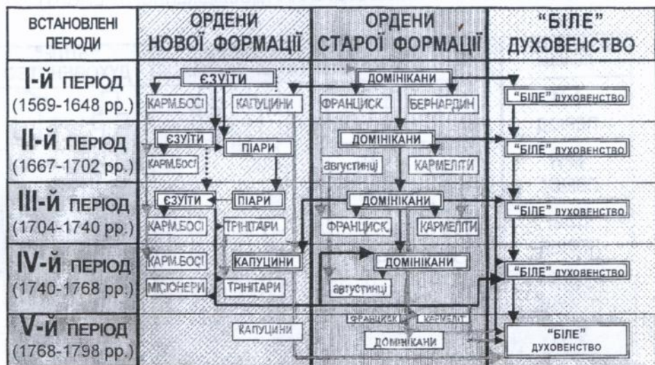
Рис. 2.9. СХЕМА ВЗАСМОВПЛИВІВ В ХРАМОБУДУВАННІ ОРДЕНІВ СТАРОЇ ТА НОВОЇ ФОРМАЦІЇ ТА БІЛОГО ДУХОВЕНСТВА ПРОТЯГОМ ВСТАНОВЛЕНИХ ПЕРІОДІВ В ДОСЛІДЖУВАНОМУ РЕГІОНІ