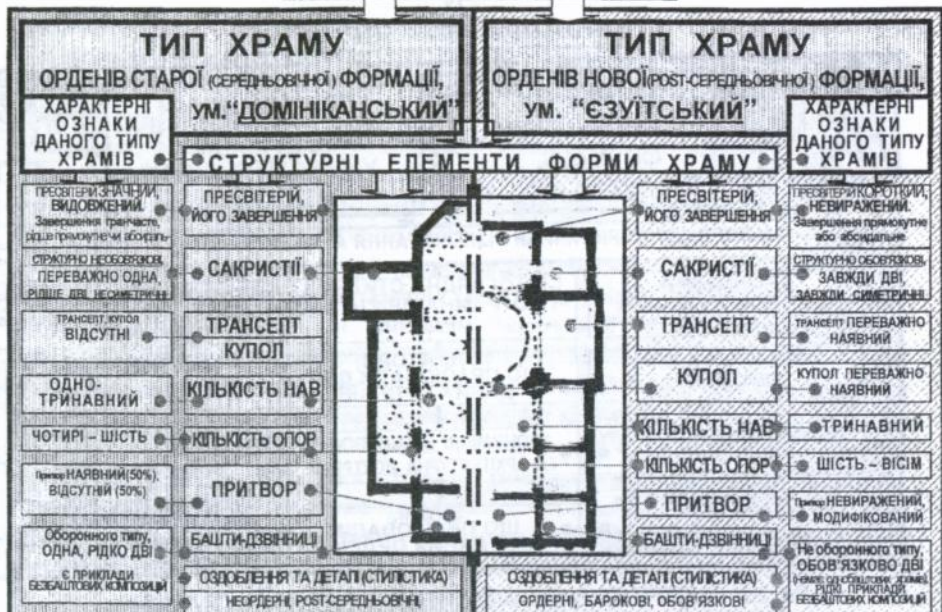
Рис. 2.26. ВИЗНАЧАЛЬНІ РИСИ АРХІТЕКТУРИ ОРДЕНІВ СТАРОЇ І НОВОЇ ФОРМАЦІЇ (ЗА МАТЕРІАЛАМИ ХРАМОБУДУВАННЯ ДОСЛІДЖЕНОГО РЕГІОНУ)