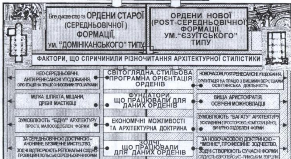
Рис. 2.8. ФАКТОРИ, ЩО ВИЗНАЧАЛИ СТИЛЬОВІ ОСНОВИ ХРАМОБУДУВАННЯ ОРДЕНІВ СТАРОЇ І НОВОЇ ФОРМАЦІЇ ТА БІЛОГО ДУХОВЕНСТВА В ДОСЛІДЖУВАНОМУ РЕГІОНІ