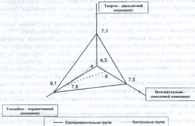
Рис. 1. Розподіл середніх балів оцінок заключного зрізу.

студентами контрольної групи свідчить про правомірність та ефективність запропонованої педагогічної технології з використанням засобів духовної музики в навчально-виховному процесі вищої школи.