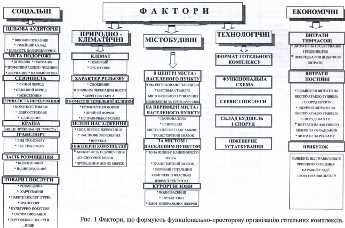
Рис. 1 Фактори, що формують функціонально-просторову організацію готельних комплексів.