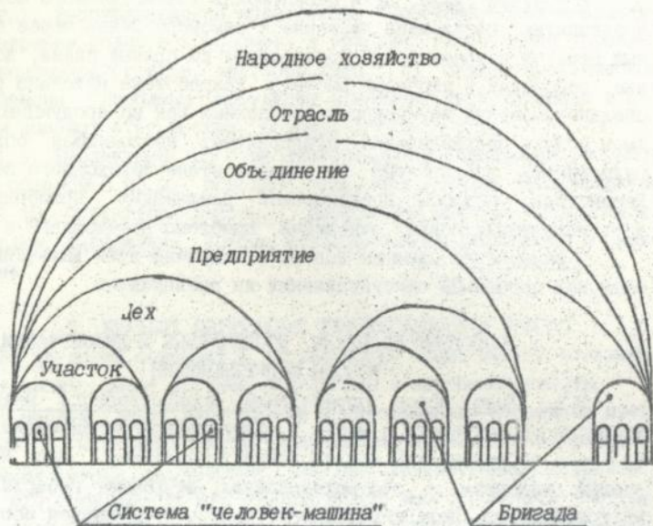
Рис. 1. Структура хозяйственного механизма

ления материального обслуживания; третья - подразделения информационного обслуживания ( в других группах информация не является предметом труда); четвертая - дирекция, в функции которой входят: а) представительство и защита интересов предприятия во взаимодействии с внешней средой; б) координация совместной работы подразделений, организация выполнения перспективных работ и общих для всех либо нескольких подразделений. Мы считаем, что предприятие состоит из совокупности подразделений, объединенных в целостную систему, одним из которых, со своими функциями, является дирекция; пятая - подразделения, выполняющие функции учета, организации движения денежных средств предприятия.