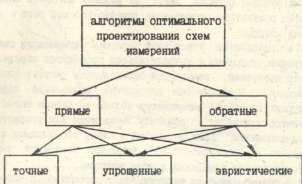
Рис 1. Классификация алгоритмов оптимального проектирования схем измерений

В 1.2 предложена следующая классификация алгоритмов оптимизации схем измерений.