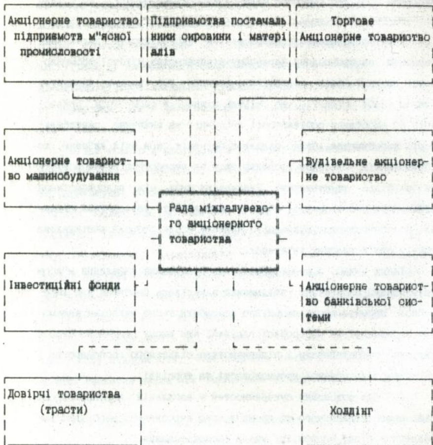
СХЕМА МІЖГАЛУЗЕВОГО АКЦІОНЕРНОГО ТОВАРИСТВА ПО ВИРОБНИЦТВУ, ПЕРЕРОВЦІ І РЕАЛІЗАЦІЇ М'ЯСА І М'ЯСОПРОДУКТІВ.