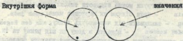
Схема змістово невмотивованого фразеологізму

У главі III "Проблема гармонізації семантики фразеологізмів" розглядається відповідність/невідповідність вмотивованості значення ФО німецької та української мов, описуються можливості передачі німецьких фразеологізмів українською мовою.