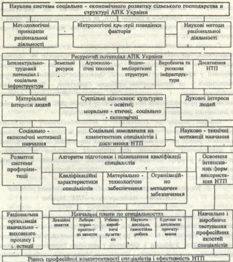
Рис Організаційні основи формування методологічних передумов соціально - економічного розвитку сільського господарства в АПК України