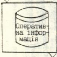
Малюнок 1. Перелік вихідних машинограм з обліку надходження, зберігання та транспортування буряків.

Ф 13 Рапорт про втрати бурякової маси та цукру при прийманні, зберіганні та транспортуванні