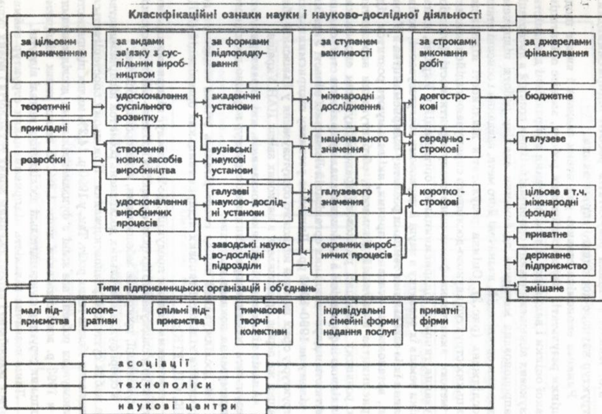
Рис.1 Класифікаційні ознаки науки і наукових досліджень та класифікація типів підприємницької діяльності