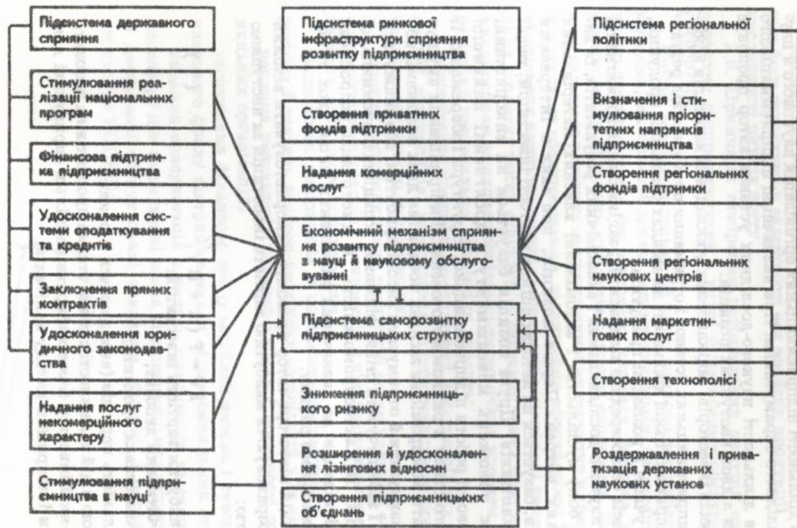
Рис. 4 Схема взаємозв'язків основних підсистем економічного механізму сприяння розвитку підприємництва в науці й науковому обслуговуванні.