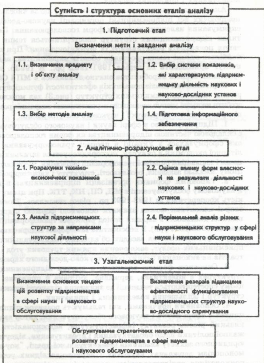
Рис. 2 Основні етапи аналізу діяльності підприємницьких структур наукового спрямування