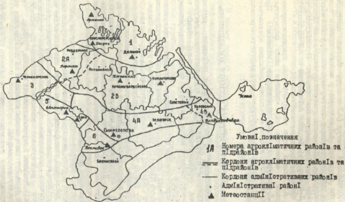
Мал. I. Агрокліматичне районування степової зони рівнинного Криму