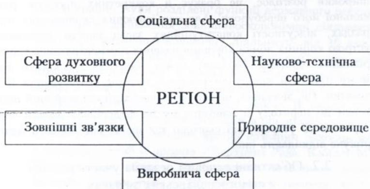
Рис. 1. Основні структурні ланки регіону як територіальної системи

Отже, регіон - складна територіальна система, підсистемами якої є виробнича, соціальна, науково-технічна, екологічна, зовнішньоекономічна та інші органічно пов'язані між собою структури, що забезпечують її життєдіяльність /див.: рисунок 1/.