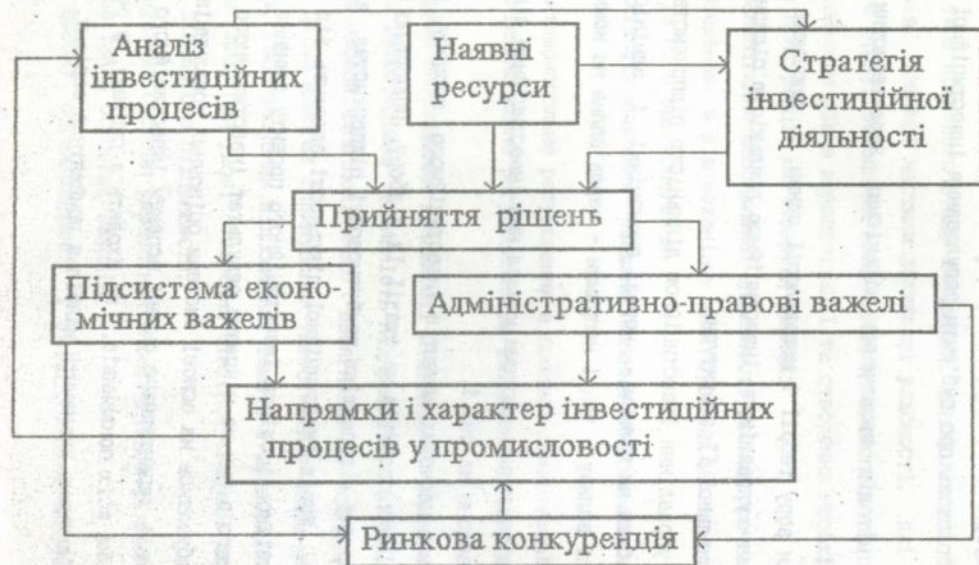
Рис.1. Схема функціонування системи управління інвестиційною діяльністю підприємств.