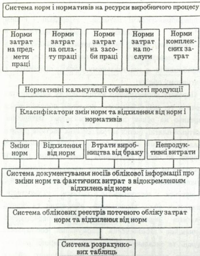
Рис. 2. Загальна побудова нормативного обліку витрат на виробництво.