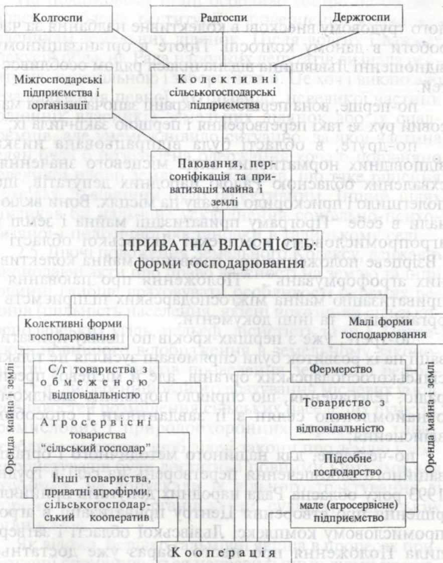
Основні етапи реформування сільськогосподарських підприємств у Львівській області