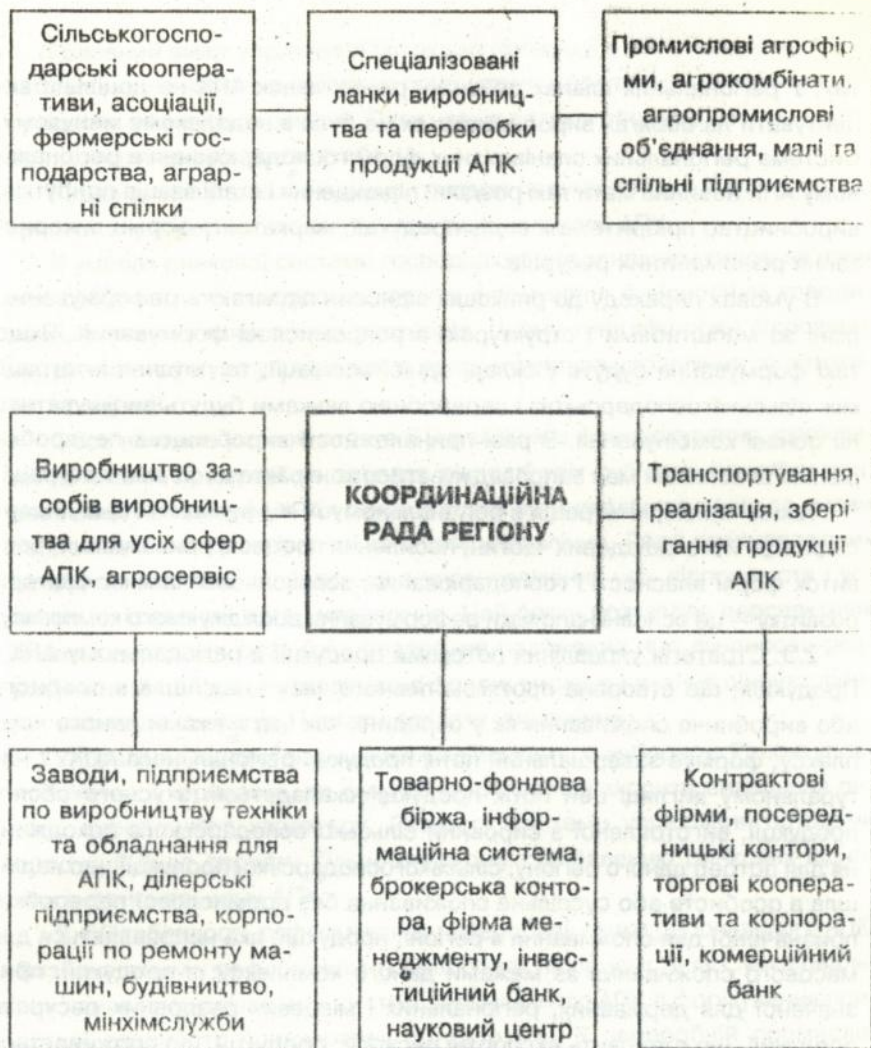
Рис.1 Структура реформованого регіонального АПК.