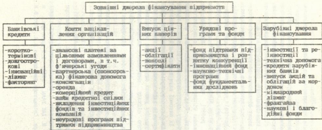
Мал.3. Зовнішні джерела фінансування підприємств (розширений перелік)