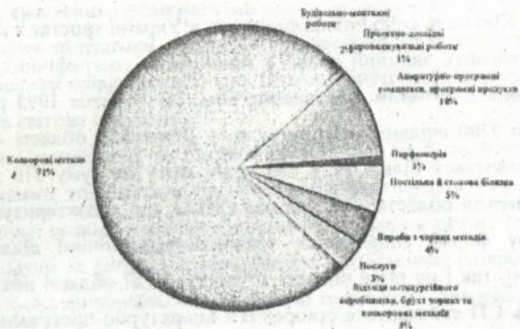
Мал.2. Структура виробництва СР

така політика економіки виправдана і має здійснюватись систематично й послідовно. Іноземні інвестори, вкладаючи свій капітал, керуються теорією міжнародного експортного маркетингу. Відповідно до цього сприятливими умовами для укладання інвестицій є: