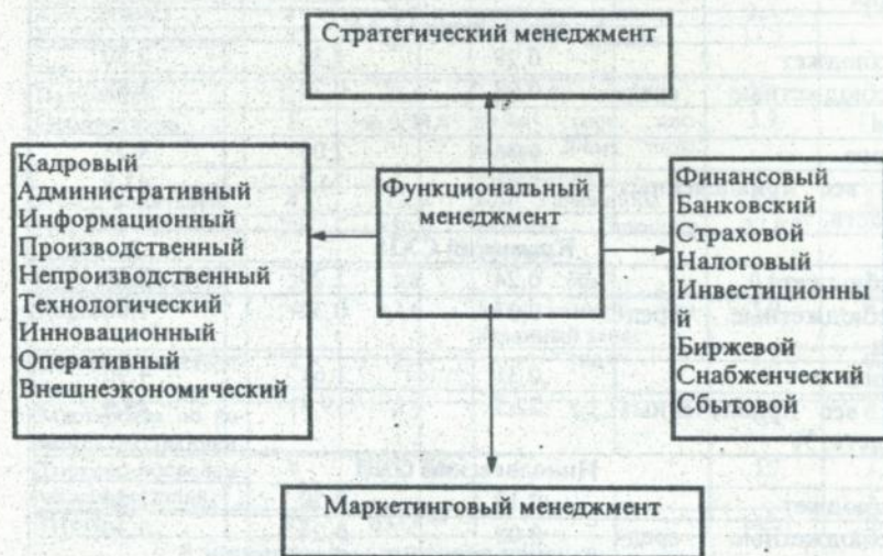
Рис.1. Общий и функциональный менеджмент в коммерческой деятельности.

Полагаем, что целесообразно выделять в коммерческой сфере производственный и непроизводственный менеджмент. Причем последний по мере совершенствования законодательства об обучении на компенсационной основе будет расширяться и становиться конкурентоспособным относительно негосударственных вузов.