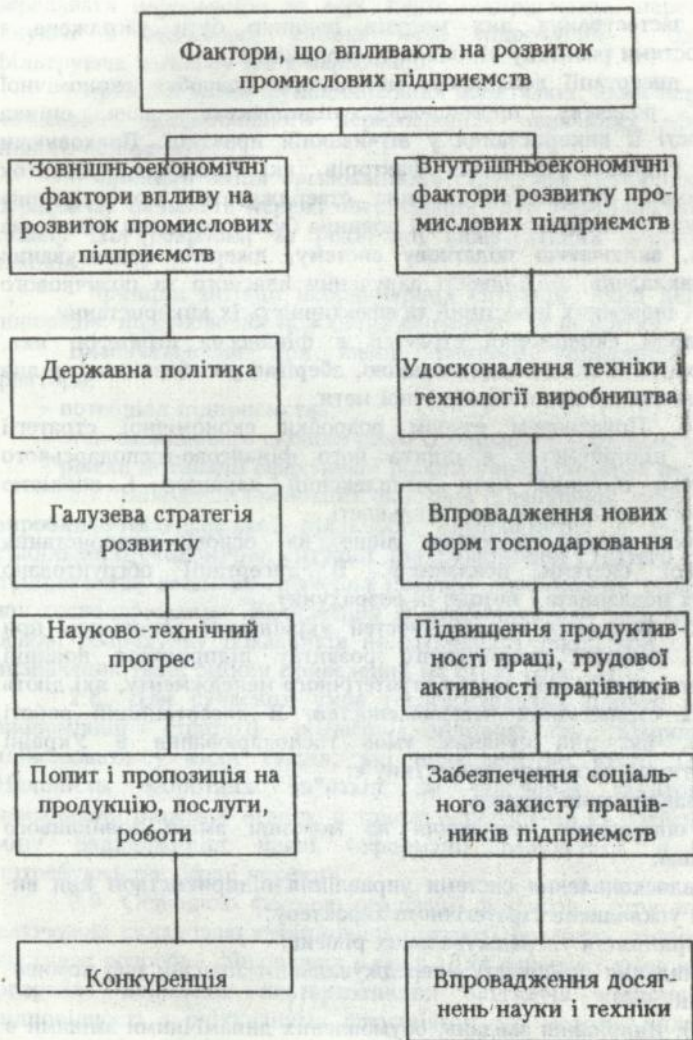
Рис. 1. Фактори впливу на розвиток промислових підприємств