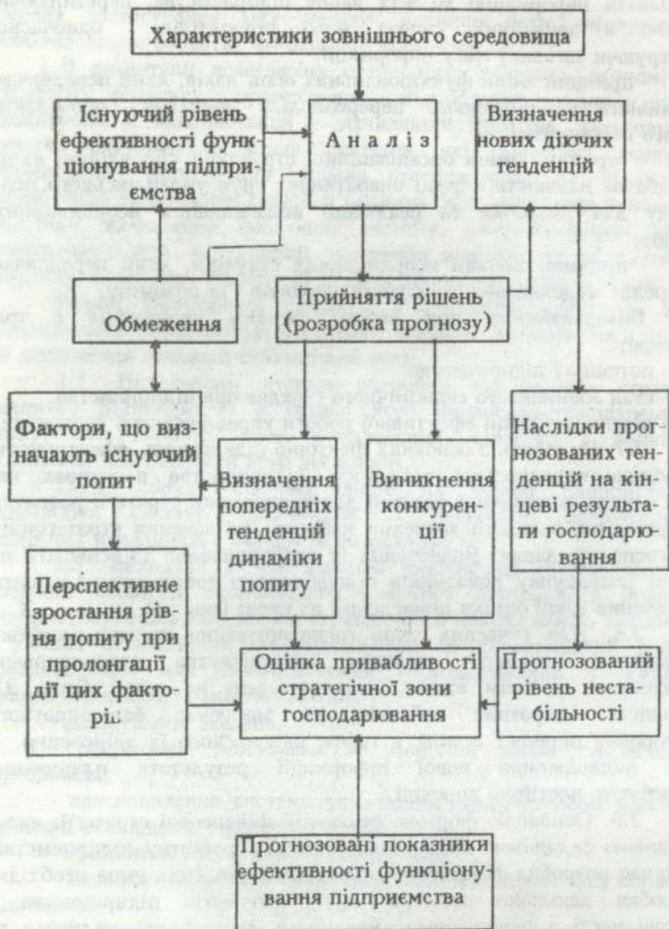
Рис. 2. Ітераційна процедура визначення оцінки привабливості стратегічної зони господарювання