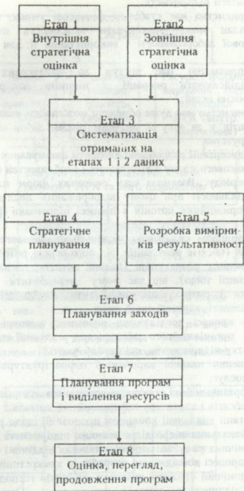
Рис. 3. Процес вироблення економічної стратегії розвитку підприємства