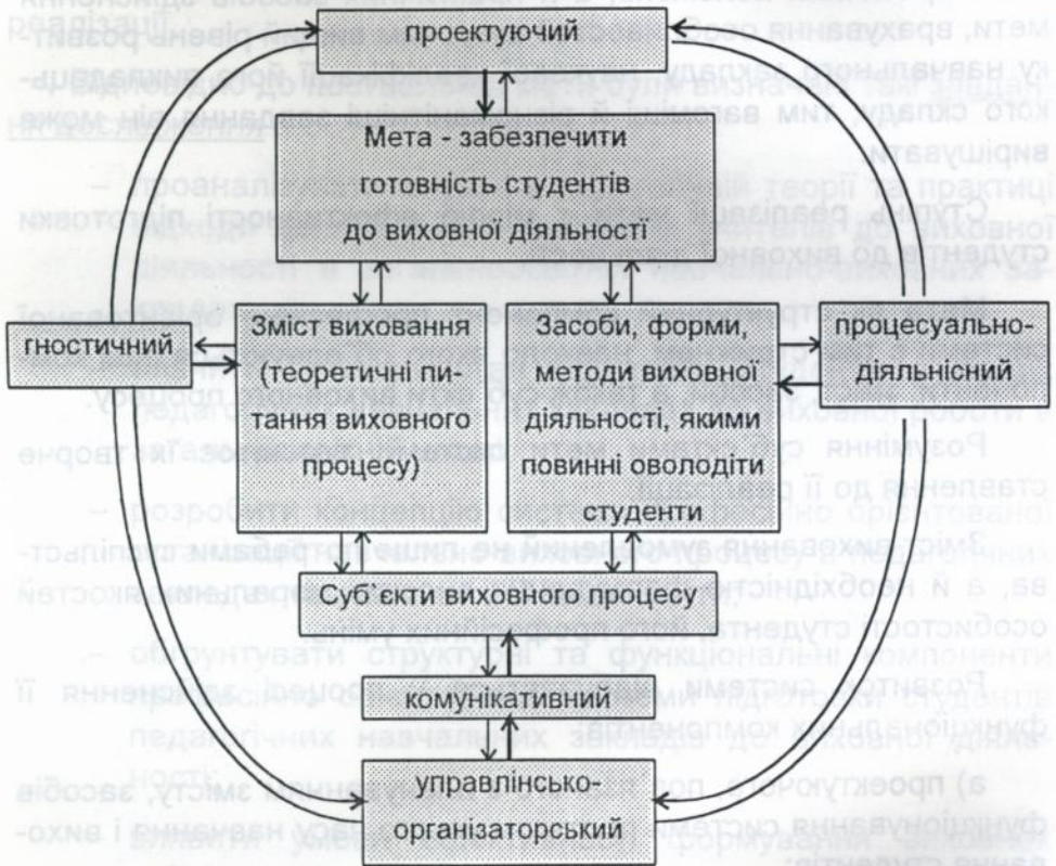
Мал. 1. Структурні та функціональні компоненти професійно орієнтованої системи підготовки студентів педагогічних навчальних закладів до виховної діяльності.

Взаємозв'язок компонентів представлено на мал. 1.