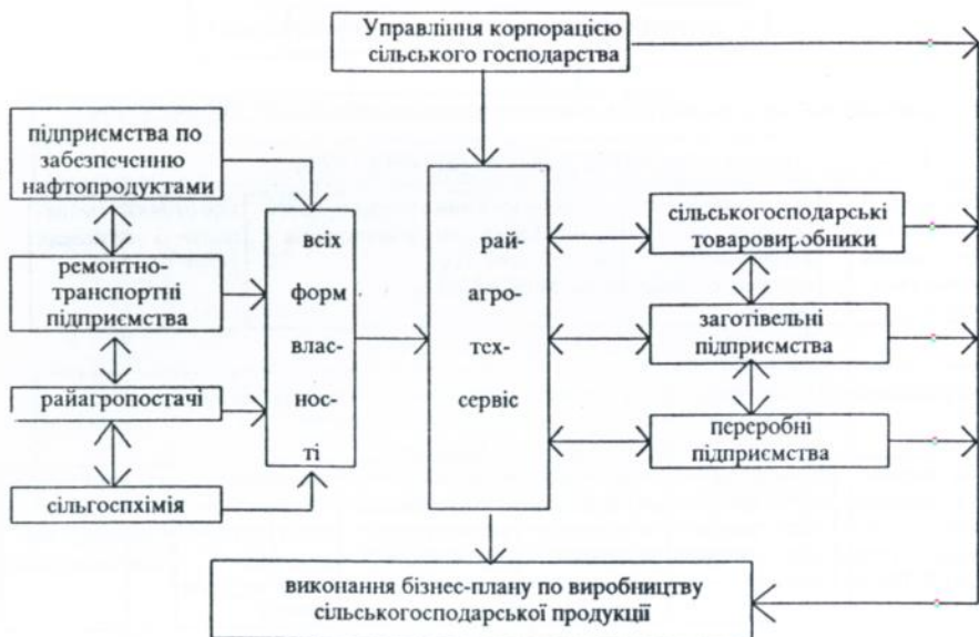
Рис. 3. Схема корпорації по забезпеченню матеріально-технічними ресурсами, виробництву, заготівлі та переробці сільськогосподарської продукції.

В це об'єднання на рівних економічних умовах повинні увійти всі служби матеріально-технічного забезпечення АПК, що зобов'язані оперативно реагувати на задоволення потреб товаровиробників усіх форм власності матеріальними ресурсами промислового виробництва. Практична реалізація цієї пропозиції протягом найближчих років поживить виробничу діяльність промислових підприємств, які нині практично простоють через неможливість попередньої оплати їх продукції, і заодно забезпечити технологічні потреби сільськогосподарських підприємств через постачання їм техніки, запчастин і паливно-мастильних матеріалів під вирощену продукцію. Пропонуємо таку схему кругообігу фінансових ресурсів корпорації по матеріально-технічному забезпеченню АПК (рис.4). По такій схемі передбачено, що держава одночасно надає цільовий кредит на поточні потреби організаціям агросервісу та сільськогосподарським товаровиробникам. На основі укладання з виробниками сільськогосподарської продукції контрактів на постачання техніки, запчастин і паливно-мастильних матеріалів під вирощену продукцію постачальницькі підприємства розробляють і до-