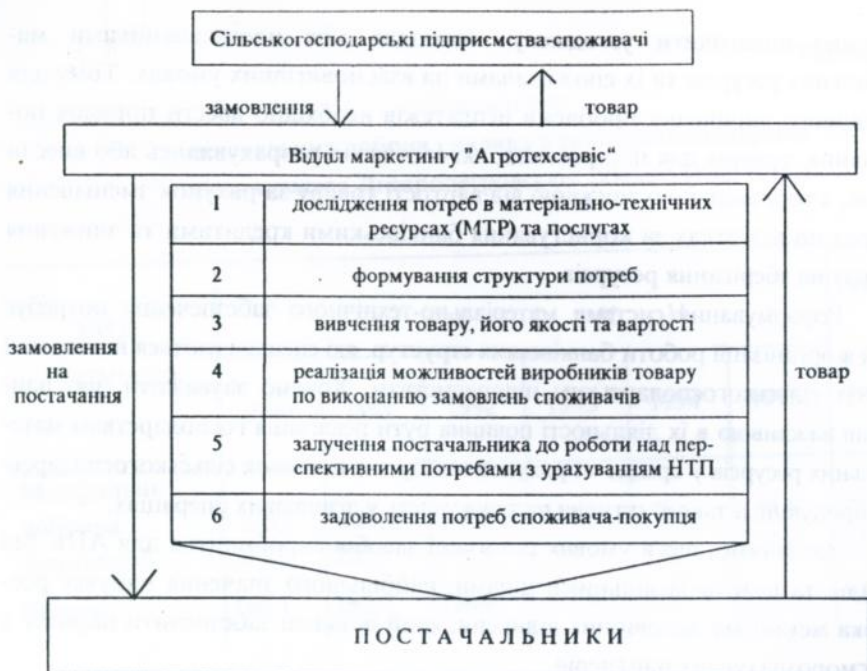
Рис.1. Схема управління переміщенням товару.

Важливо подбати про збереження цілісної інфраструктури інженерно-технічного обслуговування виробництва, здійснюючи відповідне її реформування. Вважаємо, що необхідно провести реорганізацію інфраструктури ринку інженерно-технічних послуг по такій схемі, в якій було б передбачене злагоджене функціонування всіх важливих координаційних центрів (рис.2). Успішне функціонування будь-якого координаційного центру можливо лише за умови застосування ефективних методів господарювання. Впровадження запропонованої схеми сервісної інженерно-технічної інфраструктури, максимальне наближення її до виробників сільськогосподарської продукції дасть можливість вибору тих, хто надає послуги, отже сприятиме створенню та подальшому розвитку ринку інженерно-технічних послуг. Конкуренція в основі дії такого ринку сприятиме, з одного боку, більш повному задоволенню потреб товаровиробників, з другого - підвищенню якості наданих послуг.