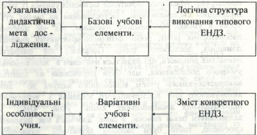
Мал.3. Схема конструювання операційно-пізнавального евристичного модуля.

У третьому розділі "Методика застосування засобів організації дослідницької діяльності учнів" показано, що експериментальні навчально - дослідницькі завдання в залежності від їх типу можуть використовуватись вчителем під час вивчення нового матеріалу; для організації домашніх досліджень; організації виконання лабораторних робіт і робіт фізичного практикуму; закріплення, повторення і узагальнення вивченого матеріалу; для здійснення контролю тощо. Структурованість процесу виконання ЕНДЗ дозволяє реалізувати неперервно - дискретний дуалізм в організації дослідження, що робить можливим забезпечити його цілісність шляхом поєднання класно-урочної та позаурочних форм навчання. Використання ЕНДЗ передбачає розробку методичних моделей їх виконання, які є орієнтовною основою для вчителя і потребують творчого підходу при їх застосуванні. Автором розроблені моделі виконання 21-го завдання та описана