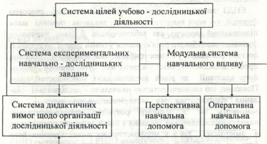
Мал. 1. Технологічна система організації дослідницької діяльності учнів

школи слід шукати в органічному поєднанні його з іншими проблемними методами навчання, зокрема з частково - пошуковим.