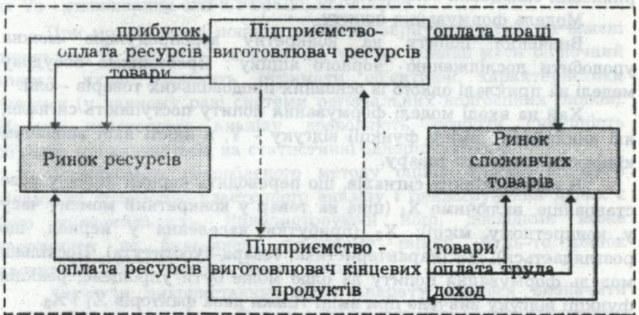
Рис. 1. Модель кругообороту ресурсів, продуктів та прибутків

Логіка галузі підводить до теорії попиту і пропонування - наріжним поняттям ринкової економіки. Традиційно у ринковій системі відрізняють два основних ринка. Перший з них є ресурсний. При ньому підприємства, що володіють ресурсами, постачають їх підприємствам-споживачам. Ці останні виступають в ролі пред'явників попиту, а перші як агенти пропонування. Тут вже люди виступають як пред'явники попиту, а роль підприємств полягає у тому, щоб бути агентами пропонування. Платежі, які провадять підприємства, коли купують ресурси, уявляє із себе витрати даних підприємств, але одночасно вони створюють потоки зароботньої плати та прибутків виробників ресурсів. Модель кругообороту ресурсів, продуктів і прибутку (дивись рис. 1) демонструє складне, але взаємопов'язане переплетення процесів прийняття рішень і економічної діяльності.