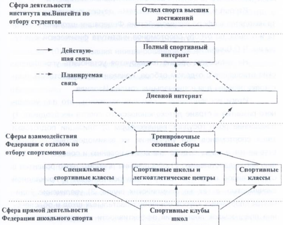
Рис.3 Организационная структура детско-юношеского спорта в Израиле.

Создание Федерации школьного спорта способствовало существенному совершенствованию системы детско-юношеского спорта в Израиле ( рис. 3).