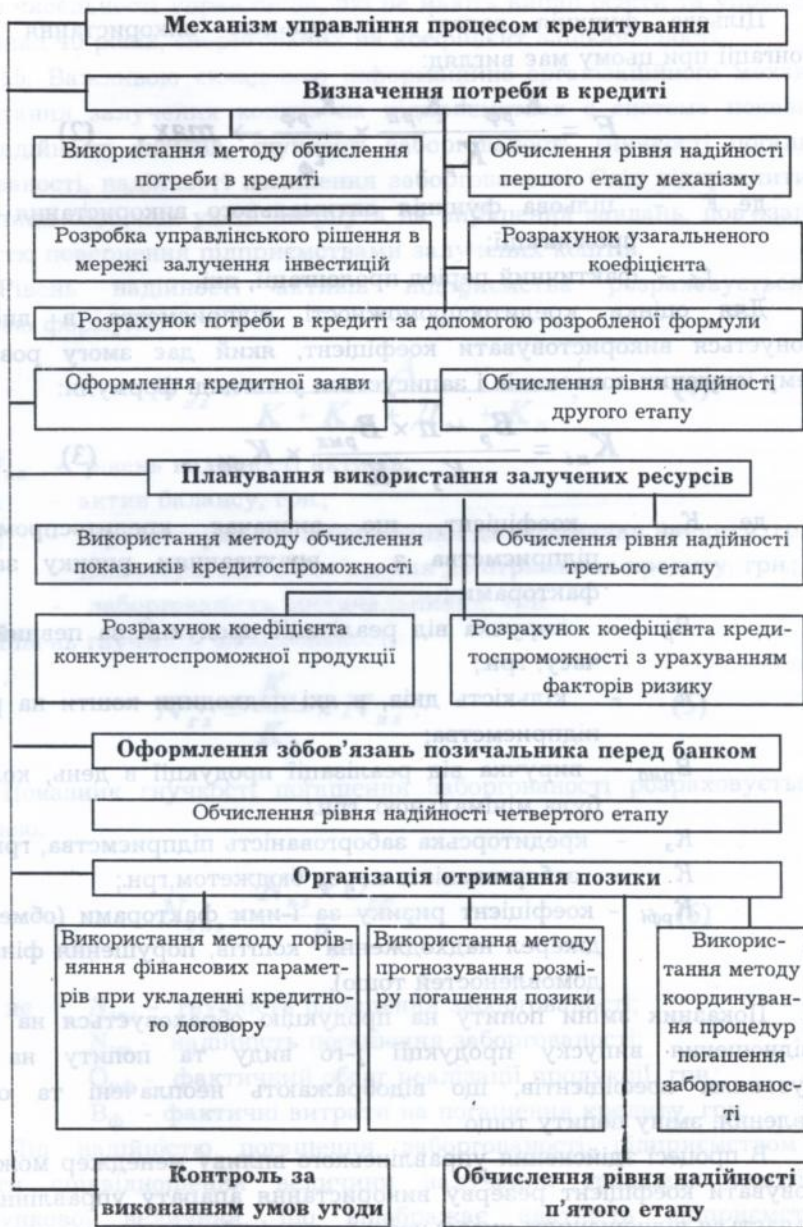
Рис. 2. Схема механізму управління процесом кредитування