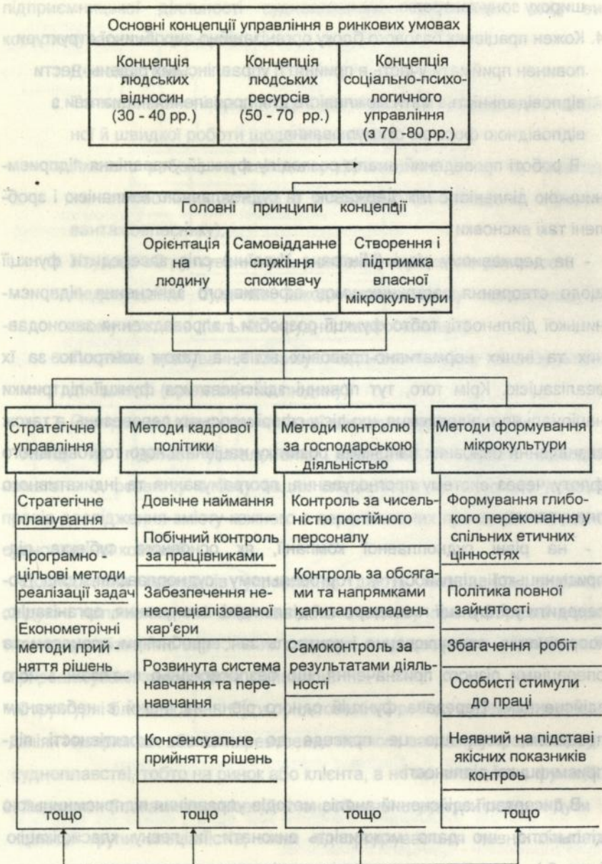
Рисунок 3 - Методи управління підприємницькою діяльністю в ринкових умовах