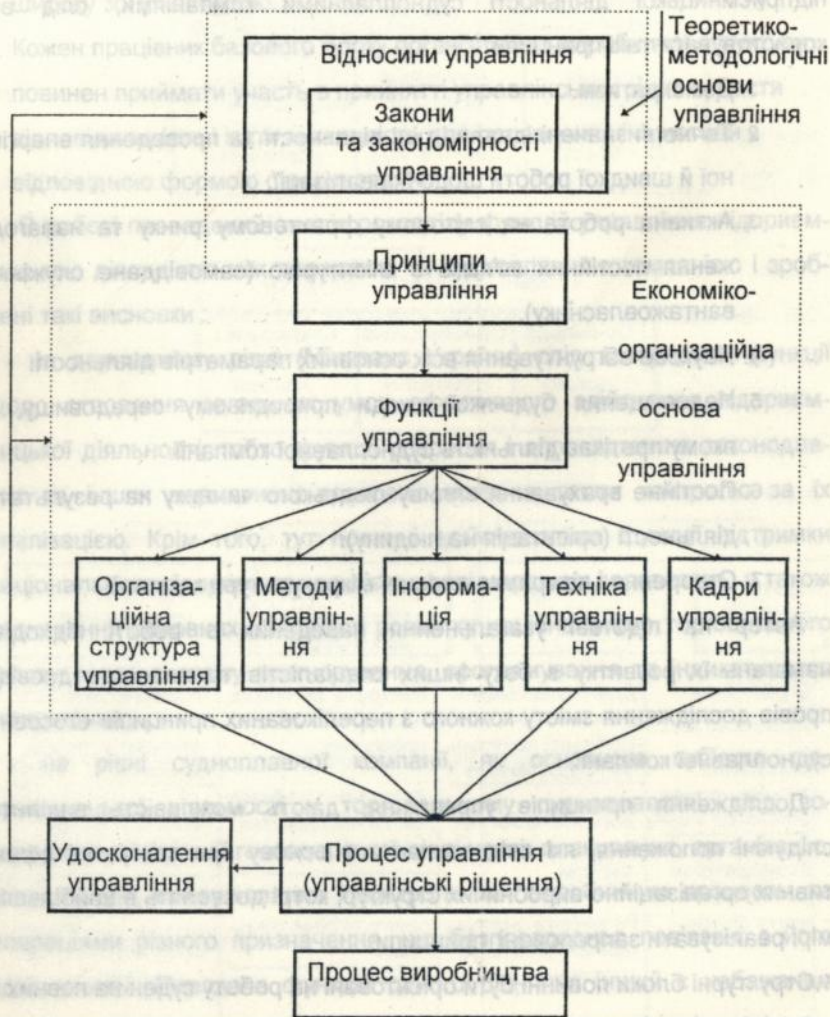
Рисунок 2 - Система управління виробництвом

В цій системі вирішальне значення має одна з важливих категорій науки управління - принципи управління.