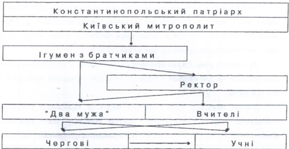
Рисунок 1. Ієрархічна модель управління Луцькою братською школою

нових керівників та вчителів, які стали передовими представниками української культури. Братська школа не лише підвищувала рівень освіченості населення, а й мала вплив на розвиток освіти і культури волинського регіону. В плані організації навчально-виховного процесу вона з успіхом конкурувала з досконалими на той час єзуїтськими училищами, які насаджувалися Річчю Посполитою на території північно-західної України.