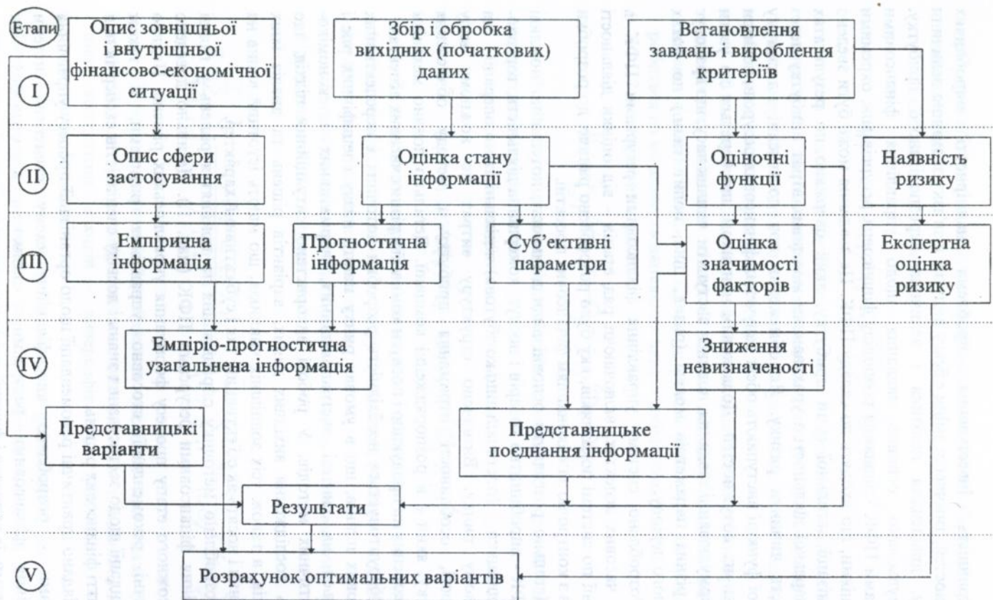
Мал. 1. Схема процесу вироблення і прийняття вирішень в галузі управління фінансовими ресурсами