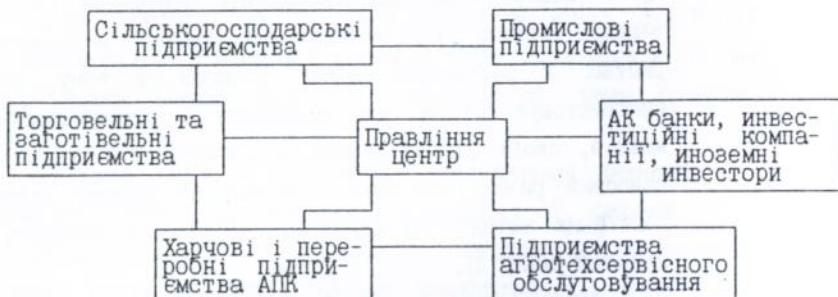
Рис. 1. Модель агропромислово-фінансової корпорації по виробництву, переробці та реалізації м'яса та м'ясопродуктів.

На основі узагальнення результатів дослідження ми дійшли висновку, що здійснення подальших соціально-економічних перетворень пов'язане з появою крупних об'єднань агропромислового типу з залученням фінансових інститутів - агропромислово-фінансових корпорацій (Рис. 1).