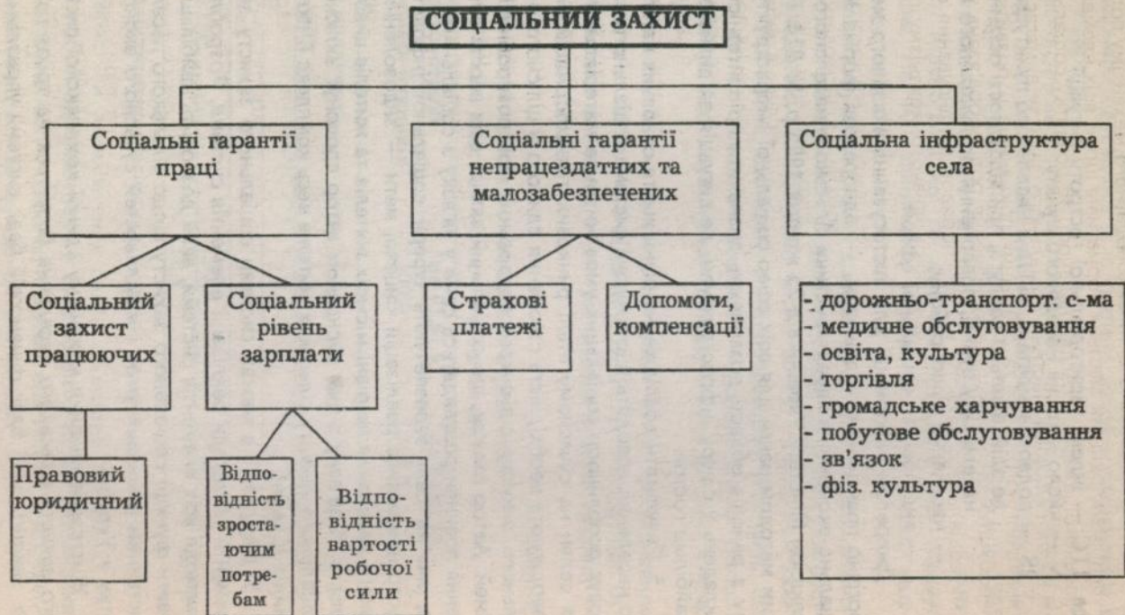
Схема Комплексна структура соціального захисту сільського населення