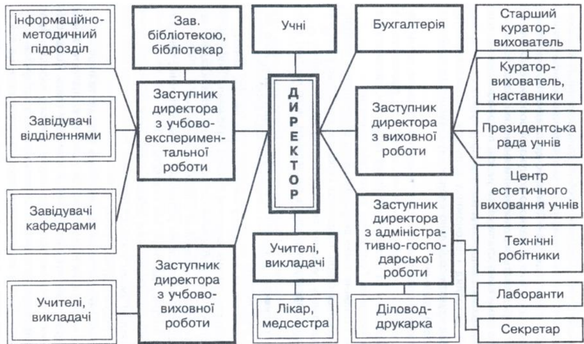
Рис. 2. Управління навчальним закладом нового типу на базі зв'язку усіх служб (блок-схема 2)