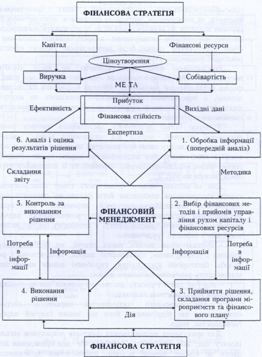
Рис. 1. Взаємодія фінансового менеджменту і фінансової стратегії сільськогосподарського підприємства.