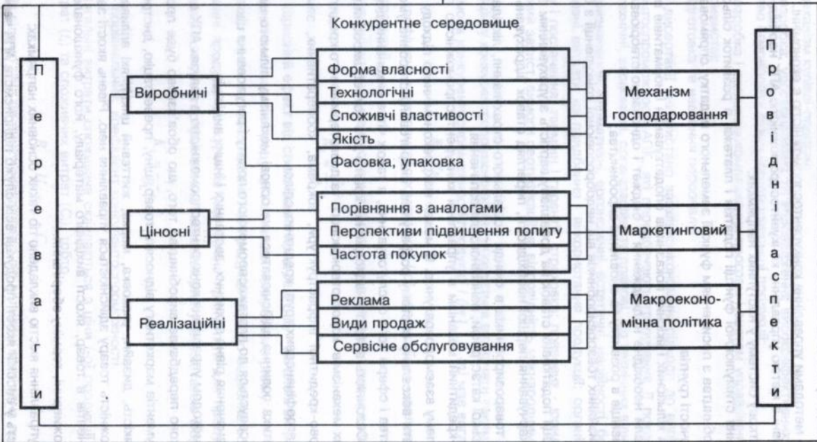
Рис. 1. Складові поняття конкурентоспроможності