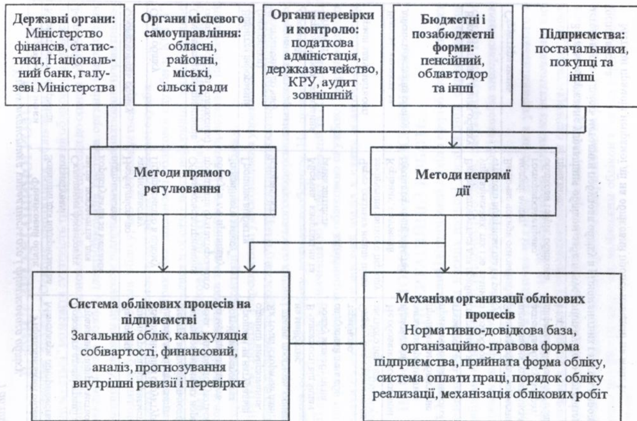
Мал.1. Система управління обліковим процесом.