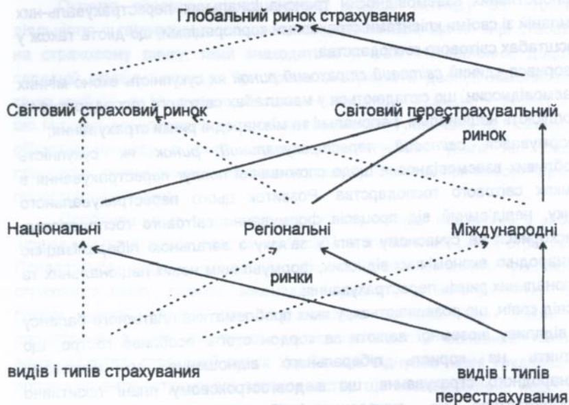
Рис.: - ієрархія світового страхового ринку - ієрархія світового перестраховального ринку