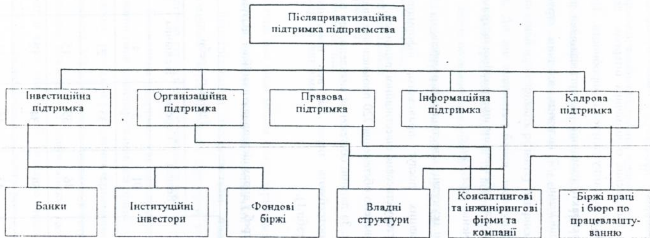
Рис. 1. Організаційна структура системи ППП