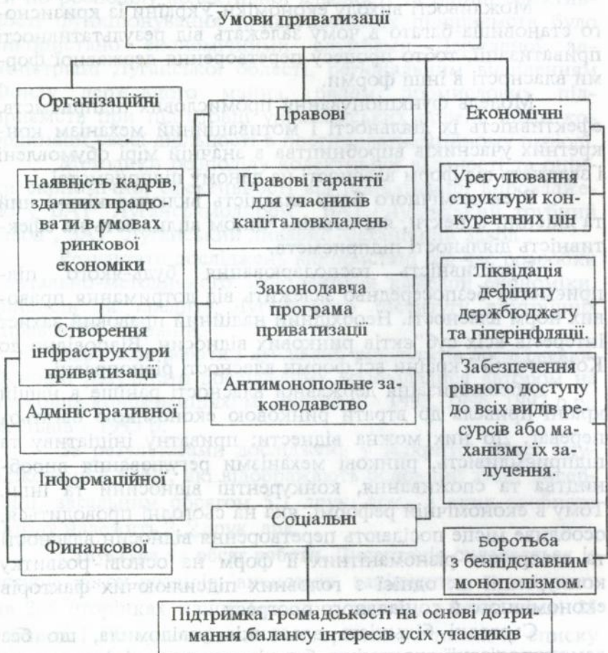
Мал.1 Класифікація необхідних умов проведення приватизації.

Результати дослідження дозволили розробити класифікацію умов приватизації (мал. 1), яка дає змогу підвищити рівень її керованості.