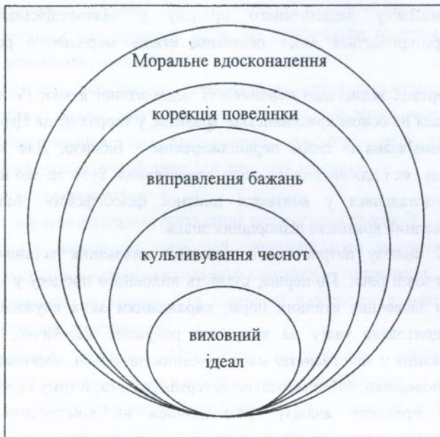
Рис. № 1. Зміст морального виховання у Біблії.

По-третє, християнська система виховання виражена у філософських термінах. У дослідженні встановлено основний педагогічний зміст фундаментальних понять святоотцівської філософії, виділено п'ять провідних у патристиці тем, в яких розглядається проблема виховання, а саме: 1) безперервне моральне вдосконалення; 2) корекція поведінки на рівні вчинків; 3) виправлення бажань і почуттів; 4) культивування чеснот на рівні мотивів діяльності; 5) виховний ідеал як безпристрасність. У ході аналізу зазначених тем встановлено між ними ієрархічний зв'язок, який вказує на динаміку педагогічного процесу і визначає зміст морального виховання у біблійній традиції, що показано графічно.