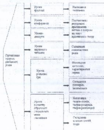
Таблиця 2. "Творча лабораторія мислення, розвитку мови і мовлення"

Четвертий блок - це вияв творчих здібностей у семінарських виступах, колоквиумах, творчих самостійних роботах.