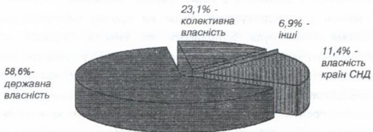
Рис.1. Форми власності на об'єкти санаторно-курортної сфери Криму.

В Криму переважає державна власність на рекреаційні підприємства (рис 1).