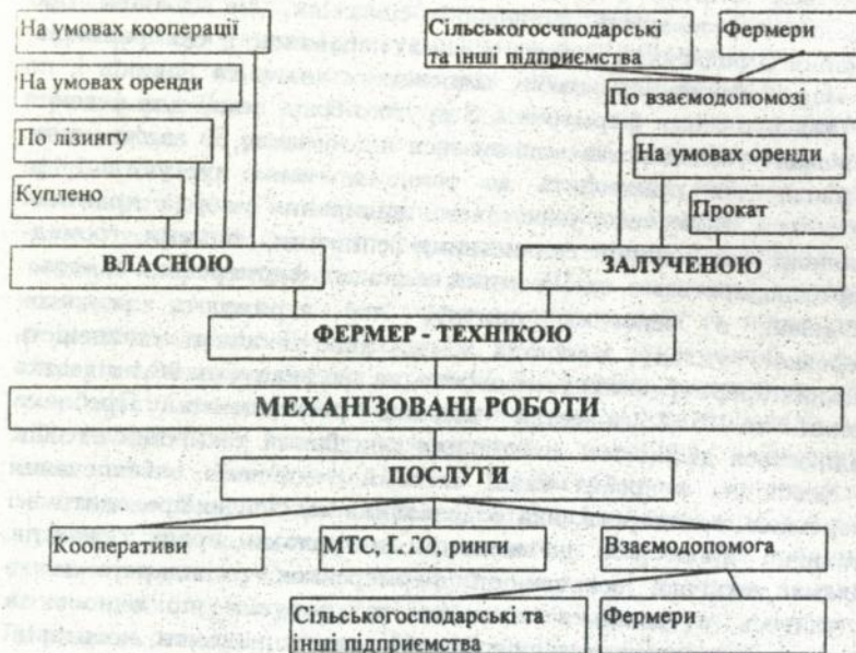
Рис. 3. Схема організації виконання механізованих робіт у фермерському господарстві

Третій вид - це кооператив як юридична особа з використанням найманої робочої сили, спільно придбаних технічних засобів, створенням підрозділу технічного сервісу.