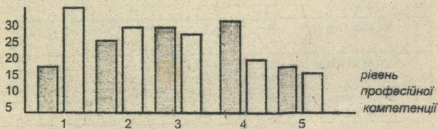
Рис. 3. Діаграма наприкінці експерименту.