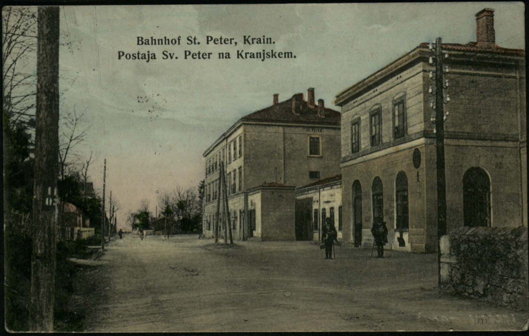
Bahnhof St. Peter, Krain. Postaja Sv. Peter na Kranjskem.